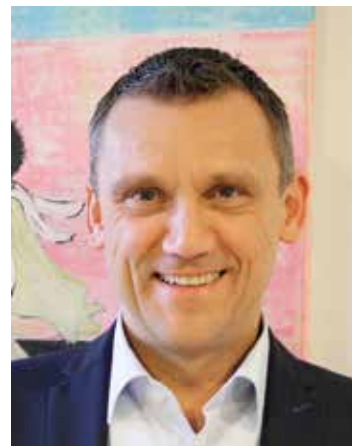
Ludwig Wahl, Erster Bürgermeister

Durch den Anbau eines lichtdurchfluteten Treppenhauses im Norden der Halle konnten weitere Funktionalitäten erreicht werden. Einerseits haben wir nun einen weiteren Eingang zum Zuschauerbereich mit Sanitärräumen, andererseits dient dieses Treppenhaus auch der Sicherheit als weiterer Fluchtweg bei Veranstaltungen. Dieser Ergänzungsbau macht es jetzt endlich auch möglich, den bisher gesperrten westlichen Tribünenteil für Zuschauer zu ertüchtigen und zu öffnen.